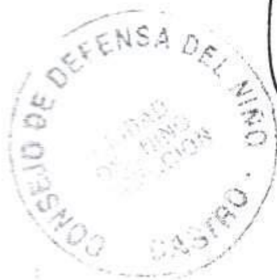
M ra de Lourdes Obreque S. Asistente Social DIRECTORA

La evaluación en términos cualitativos es muy favorable y dentro de nuestra programación contemplaremos este tipo de actividades incluyendo la metodología utilizada.